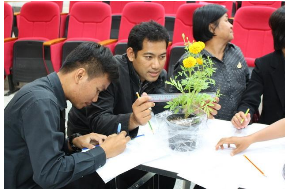
ภาพที่ 7-8 ปฏิบัติการศึกษารรณไม้ด้วยแบบบันทึก ก.7-003