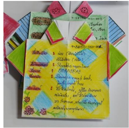
ภาพที่ 11-14 ผลงานของผู้เข้ารับการฝึกอบรม