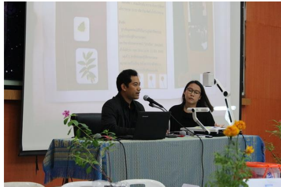
ภาพที่ 9-10 ผู้เข้ารับการฝึกอบรมนำเสนอผลงาน