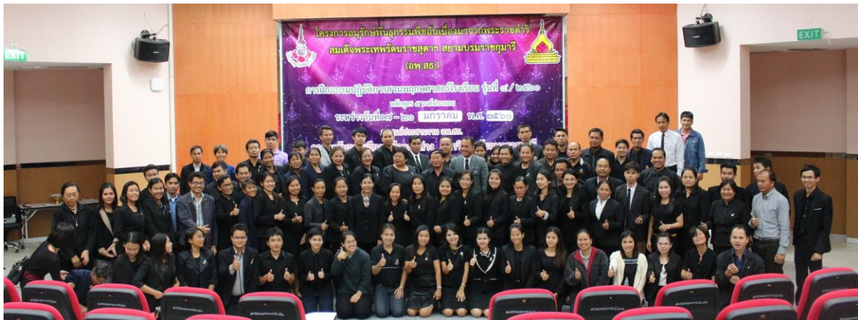
ภาพที่ 15 พิธีปิดการฝึกอบรม