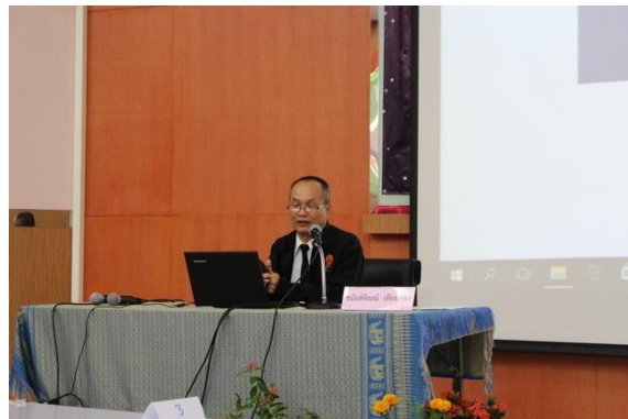
ภาพที่ 1-4 วิทยากรบรรยายแนวทางการดำเนินงานสวนพฤกษศาสตร์โรงเรียน